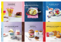
Petits cadeaux de dernière minute