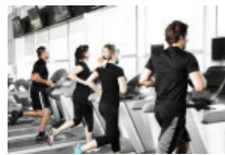
Avoir du cardio à l'ouvrage