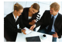
Les assurances: un métier d'avenir