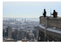
Sport, Hiver, Montréal : Bons plans hivernaux pour jouer dehors